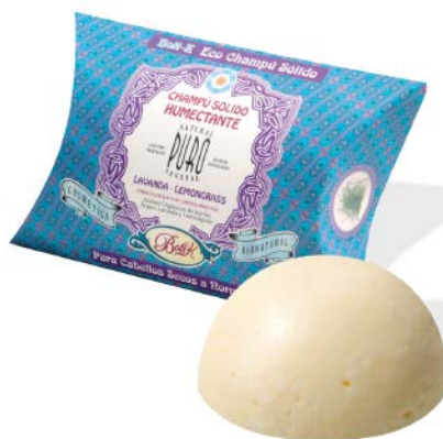
ЛАВАНДА И ЛЕМОНГРАС