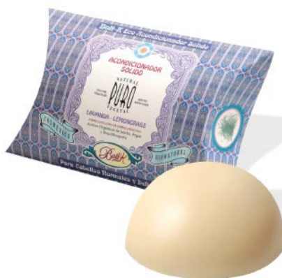
ЛАВАНДА И ЛЕМОНГРАС