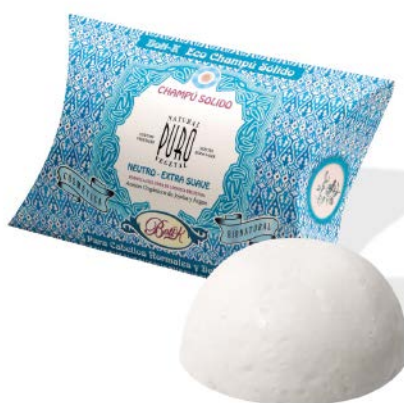
НЕЙТРАЛЬНОЕ ОЧЕНЬ МЯГКОЕ Твёрдый Эко Шампунь

Без сульфатов с добавками натуральных органических масел