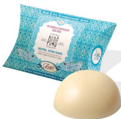
НЕЙТРАЛЬНОЕ ОЧЕНЬ МЯГКОЕ Твёрдый Эко Кондиционер

Нейтральный аромат. Показан для чувствительных волос