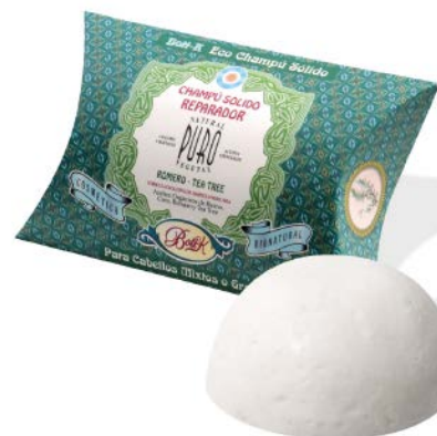
РОЗМАРИН И ЧАЙНОЕ ДЕРЕВО Твёрдый Эко Шампунь

Свежий травяной аромат. Показан для жирных волос.